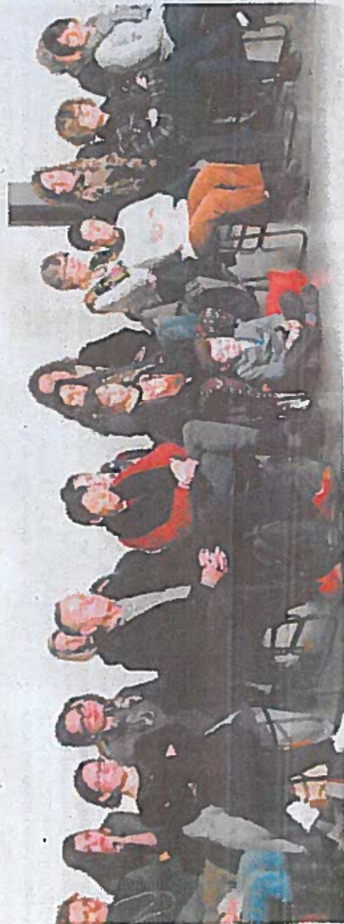
Cent dix personnes ont assisté au spectacle "Coup de foudre à Guor".