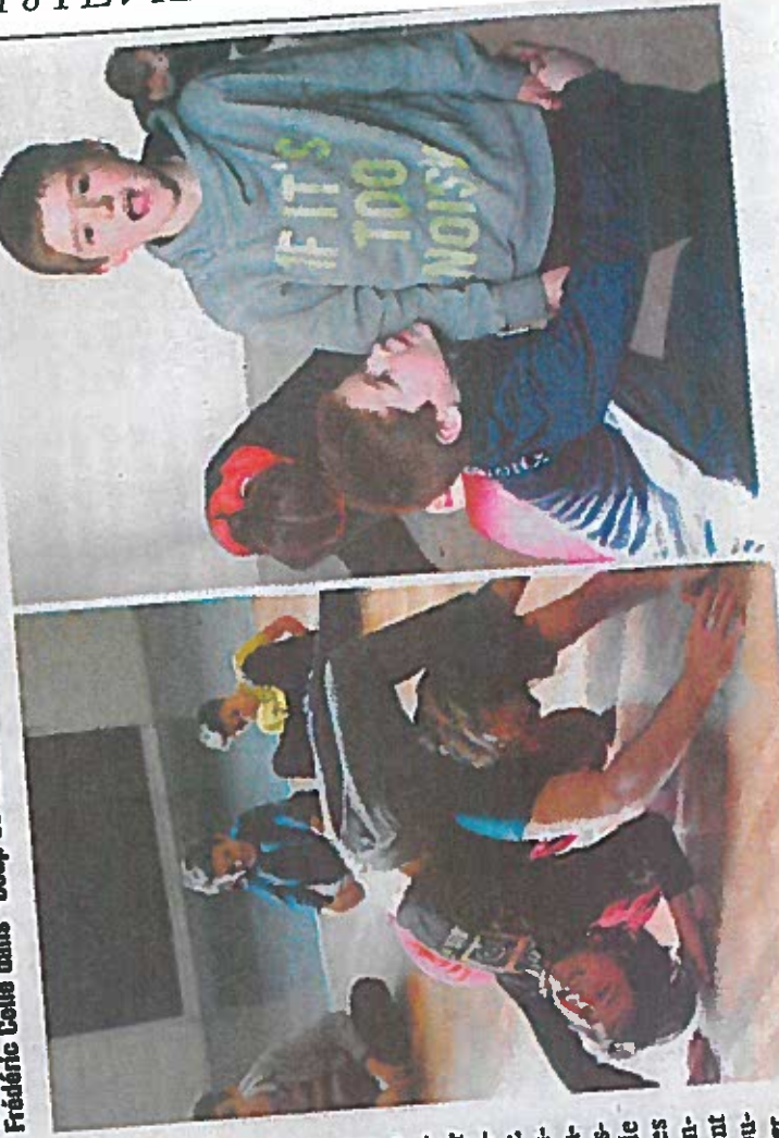
Les élèves de Gu ont réussi - à s'ouvrir, se lâcher -.