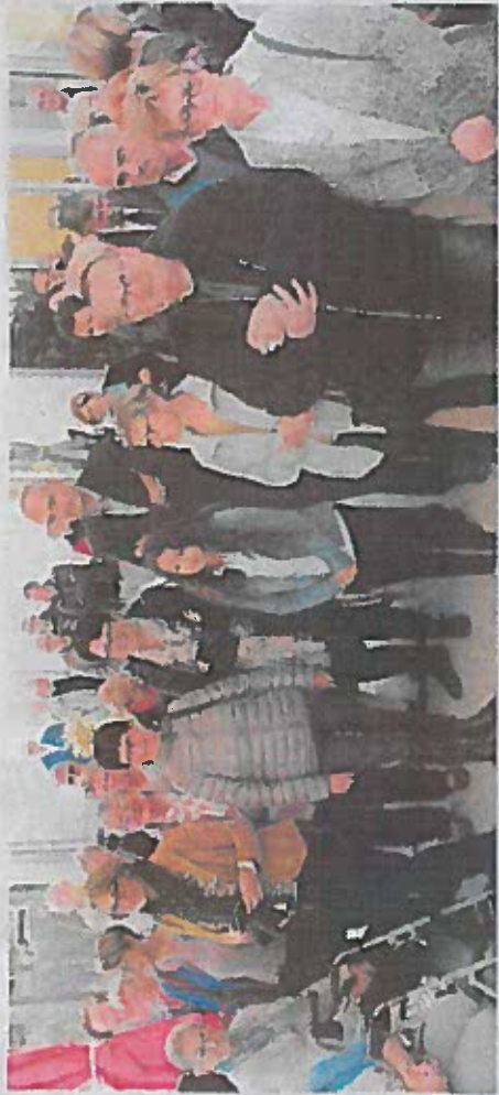
Résidents, familles, bénévoles, et personnels ont assisté à l'inauguration de l'Ehpad.

La partie rénovée a comme prévu été livrée en juillet. L'ancienne cuisine a été transformée en « pôle de soins et bureau ». Le tout « améliore la circulation. Et les équipes soignantes ont plus d'espaces de travail ». Elles s'occupent de 65 personnes âgées, dont 13 désorientées. La moyenne d'âge d'entrée « est de 87 ans. Nous